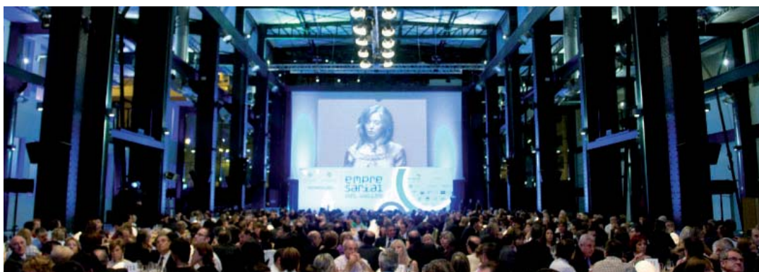
_Imatge de la sala en un dels moments de l'acte.

La 1a Nit Empresarial del Vallès va néixer al 2008 amb la unió de la festivitat dels professionals i empresaris del metall, l'automoció i l'electricitat de la comarca del Vallès Occidental. Amb aquesta unió de les 3 entitats es va aconseguir que el sopar esdevingués el lloc de trobada empresarial de referència dins del sector del metall.