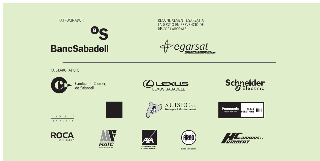
Exemple d'aplicació de logotips (patrocinadors/col·laboradors 2008)

L'aprovació final de la proposta de patrocini la farà la comissió organitzadora de l'acte. Els patrocinadors i la institució signaran un document de patrocini per concretar la col·laboració final. A les quantitats especificades caldrà aplicar l'Iva corresponent.