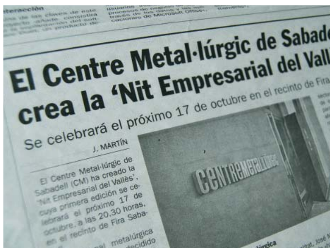
Reculls de premsa en diferents diaris.