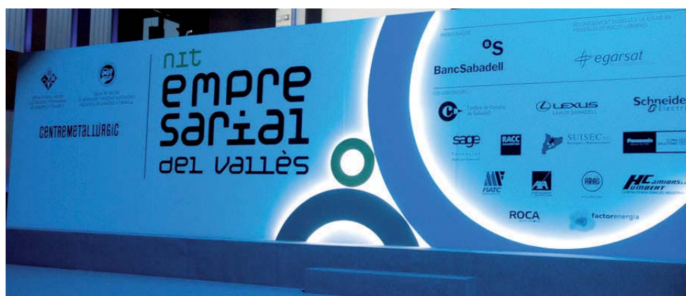
_Escenari de la Nit de Empresarial 2010 amb tots els patrocinadors i col·laboradors de l'acte.

La mida del logotip de la companyia en els suports és el que marca la diferència visual de l'aportació econòmica.