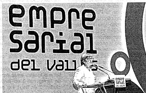
Parlamento de la consellera de Treball de la Generalitat